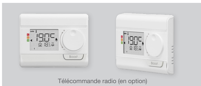
Télécommande radio (en option)