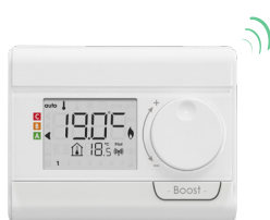
Télécommande RF optionnelle