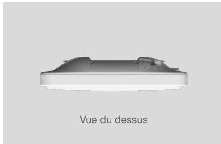
Vue du dessus