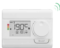
Télécommande RF optionnelle