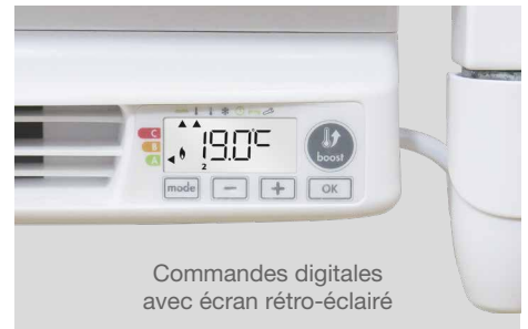
Commandes digitales avec écran rétro-éclairé