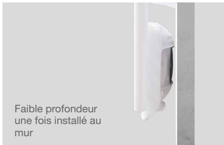
Faible profondeur une fois installé au mur